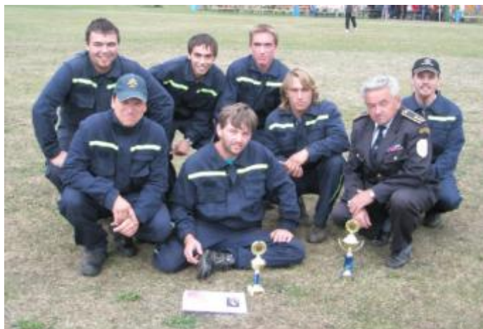
1.místo Nepomuk 2009