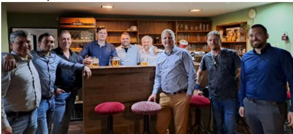
Posezení ke Dni matek v květnu 2025

Závěrečné hodnocení činnosti za rok 2025 vyhodnotí velitel sboru, ale již nyní můžeme zhodnotit končící rok jako rokem úspěšným. Převzali jsme do užívání vozidlo VW Caravelle, členové JSDHO rozvíjeli své znalosti o technice, radiové komunikaci a prošli školením řidičů. Plánované tradiční akce sboru byly uskutečněny, až na odvolání jarních maškarních plesů zapříčiněného odchodem provozovatele kulturního zařízení. Novou zkušeností bylo zajištění květnového posezení ke Dni matek.