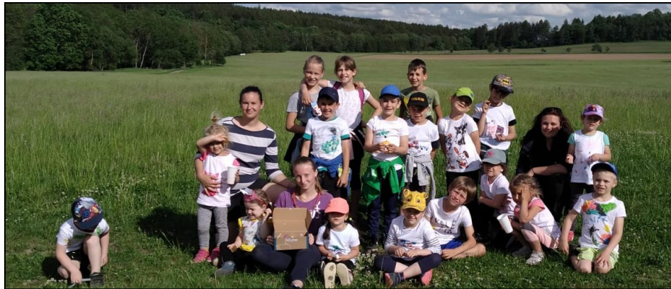
hasičské děti při hledání sladkého pokladu

V sobotu 21. května jsme uspořádali seznamovací akci v hasičárně pro mladé hasiče a jejich sourozence s rodiči. Všechny zúčastněné děti si v hasičárně vyrobily hasičská trika a společně jsme vyrazili na stezku za pokladem. Pro děti byla připravená stopovačka, při které plnily hasičské úkoly. Na konci cesty byl připraven poklad se sladkostmi. Po návratu do hasičské zbrojnice jsme pro děti připravili pečené maso a buřtíky. Dětem se akce líbila a spolu s rodiči zůstali do večerních hodin.