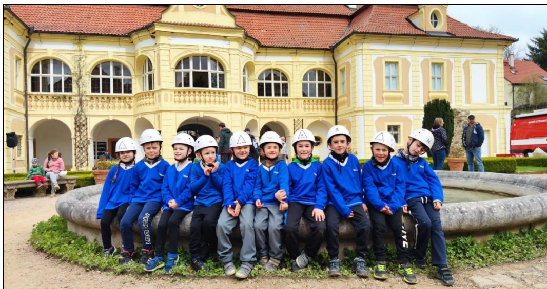
Přípravky – Nebílovy 23. 4. 2022

V sobotu 21. května jsme uspořádali seznamovací akci v hasičárně pro mladé hasiče a jejich sourozence s rodiči. Všechny zúčastněné děti si v hasičárně vyrobily hasičská trika a společně jsme vyrazili na stezku za pokladem. Pro děti byla připravená stopovačka, při které plnily hasičské úkoly. Na konci cesty byl připraven poklad se sladkostmi. Po návratu do hasičské zbrojnice jsme pro děti připravili pečené maso a buřtíky. Dětem se akce líbila a spolu s rodiči zůstali do večerních hodin.