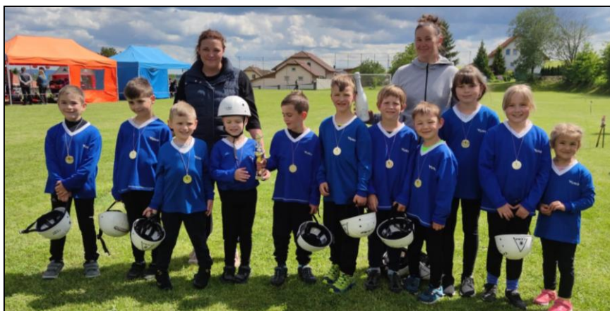
Nezbavětice 28. května 2022

Rozloučení se školním rokem se neslo v duchu hasičské pěší výpravy. Děti místo posledního pátečního tréninku podnikly pěší výlet ze hřiště ve Štěnovickém Borku do Čižic, kde pro ně bylo připraveno občerstvení a posezení na místním hřišti. O letních prázdninách je čeká pauza, která bude zpestřena hasičskou ukázkou na domácích závodech mužů a žen. Děti zde ukáží, co se v jarních měsících naučily. Tímto bychom Vás chtěli pozvat na hasičskou sportovní soutěž mužů a žen v rámci závodů Západočeské hasičské ligy, která se bude konat ve sportovním areálu v sobotu 23. července 2022 od 11.00 hodin . Občerstvení a dobrá atmosféra je zajištěna.