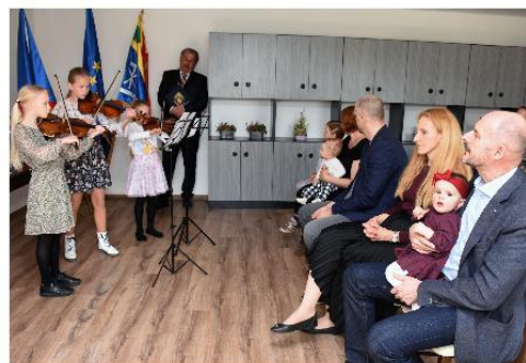
Vítání občánků ve Štěpoušickém Borku 16. 4. 2023