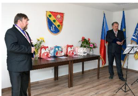
Vítání občánků ve Štěpoušickém Borku 16. 4. 2023