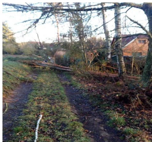
Výbor SDH Š. Borek