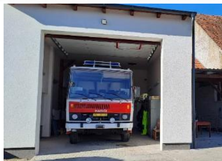
Nový vzhled vjezdu pro CAS 25.