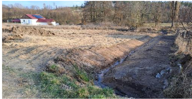
Pohled na parcelu 310/5